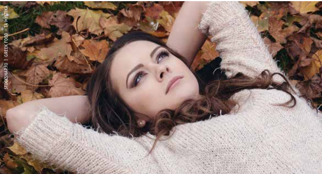
STOCKSNAP.10 | GREEK FOOD - TA MYSTIKA

Met welke gedachten heb je jezelf in het verleden beperkt in het leven van je passie?