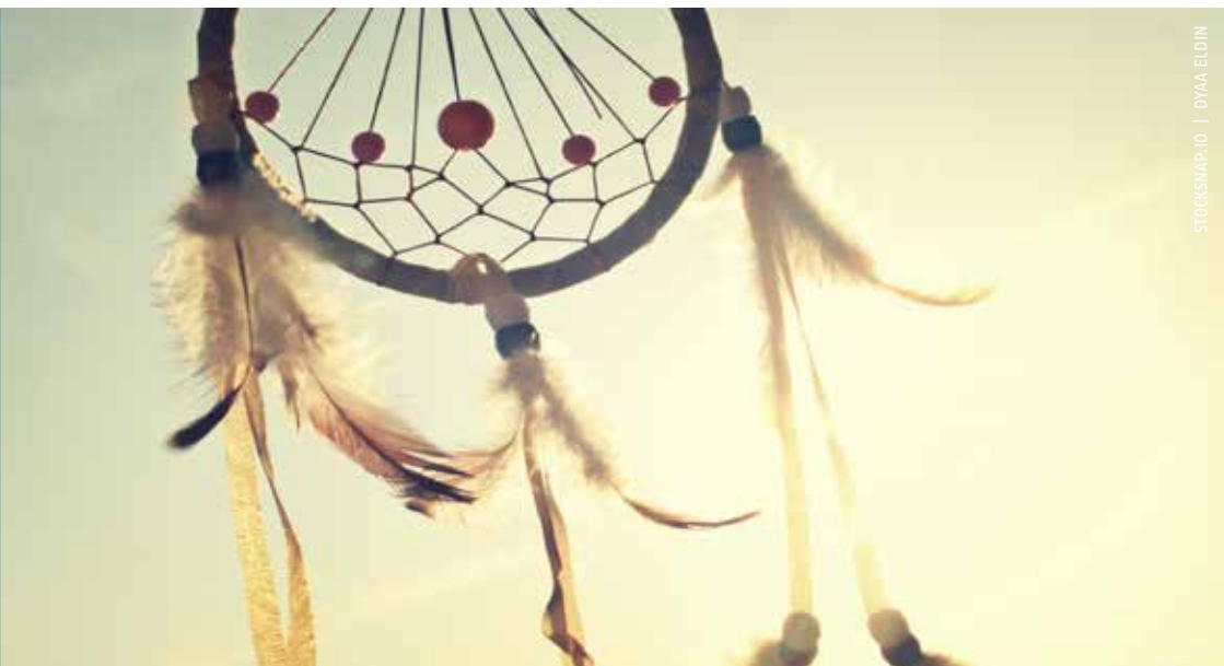
STOCKSNAP.IO | DYAA ELDIN

Stel dat je mag dromen, zonder beperkingen, wat zie je jezelf dan doen?